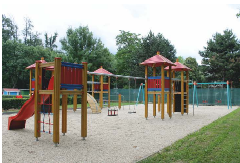
Vybudovanie nového detského ihriska a fitzóny na letnom kúpalisku