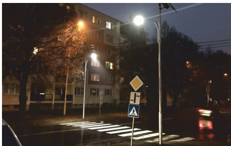
Vybudovanie bezpečnostného osvetlenia na priechodoch pre chodcov na najfrekvencovanejších úsekoch v meste