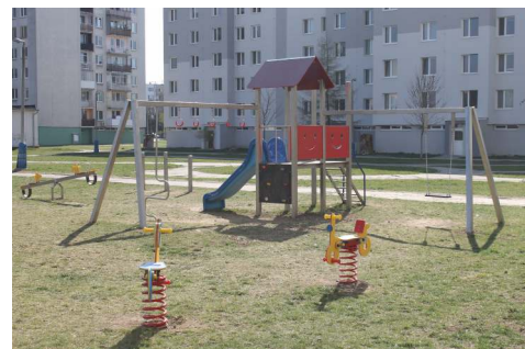
Vybudovanie detského ihriska na sídlisku Stred