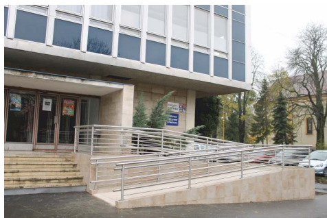
Vybudovanie bezbariérového vstupu do budovy MsKS