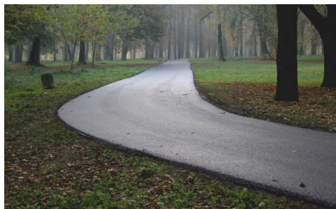
Uzatvorenie okruhu chodníkov v mestskom parku – rekonštrukcia chodníka „Milenecká“