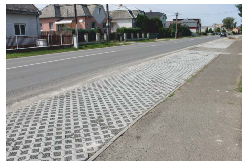
Vybudovanie novej odstavnej plochy pozdĺž cintorína v časti mesta Milhostov