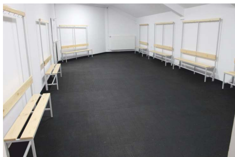
Vybudovanie novej šatne s rekuperáciou v priestoroch zimného štadióna