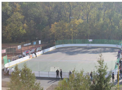
Vybudovanie hokejbalového ihriska