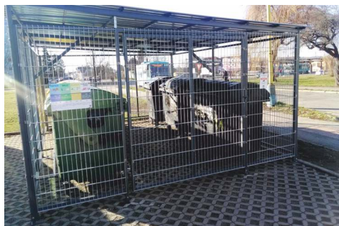
Vybudovanie stojísk na zber separovaného a zmesového komun. odpadu pri bytových domoch