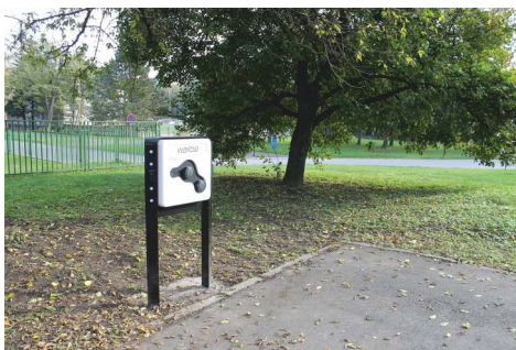
Vybudovanie elektronabíjacej stanice