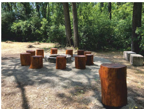
Oživenie známeho ihriska „Marakana“