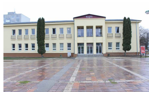
Rekonštrukcia fresky a obvodového plášťa budovy starej KaSS