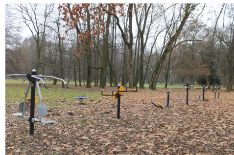
Vybudovanie fitness v mestskom historickom parku