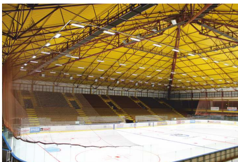
Rekonštrukcia osvetlenia na zimnom štadióne