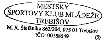
----- Prijímateľ dobrovoľníckej činnosti