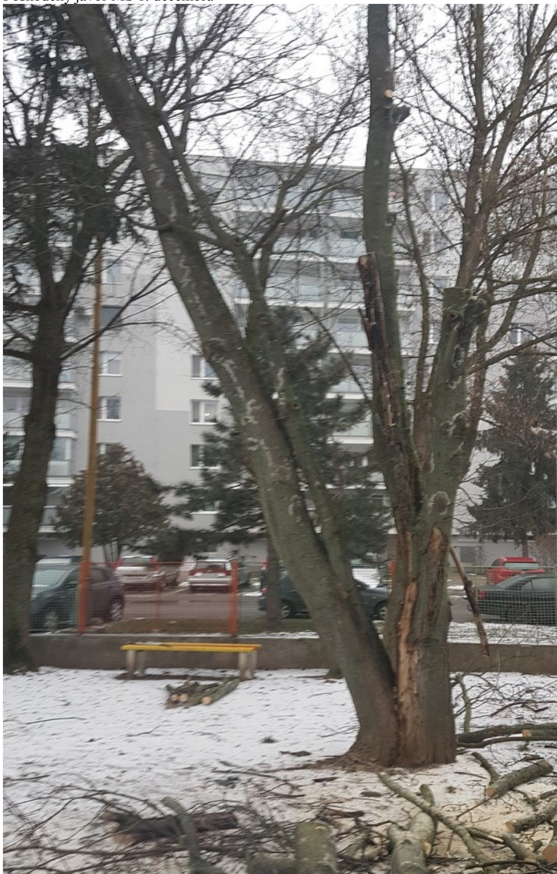
Poškozený javor MŠ 1. decembra