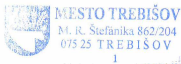
PhDr. Marek Čižmár primátor

Toto oznámenie má povahu verejnej vyhlášky podľa § 36 ods. 4 zák. č. 50/1976 Zb. /stavebný zákon/ v znení neskorších predpisov a musí byť vyvesené po dobu 15 dní na úradnej tabuli mesta Trebišov.