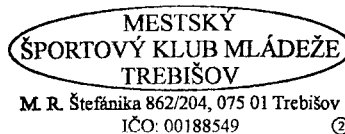
..... Prijímateľ dobrovoľníckej činnosti