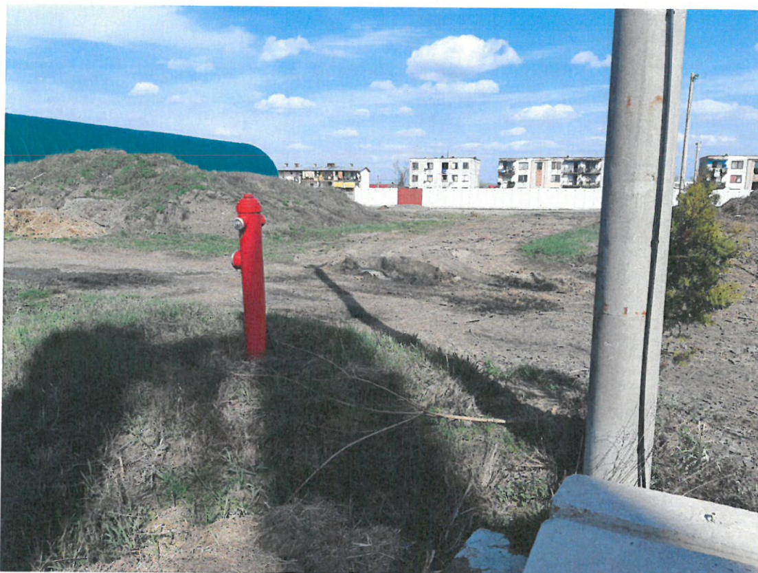
Parcela č. 1434/1 situovaná v rámci areálu spoločnosti Trebišovská energetická, s.r.o.