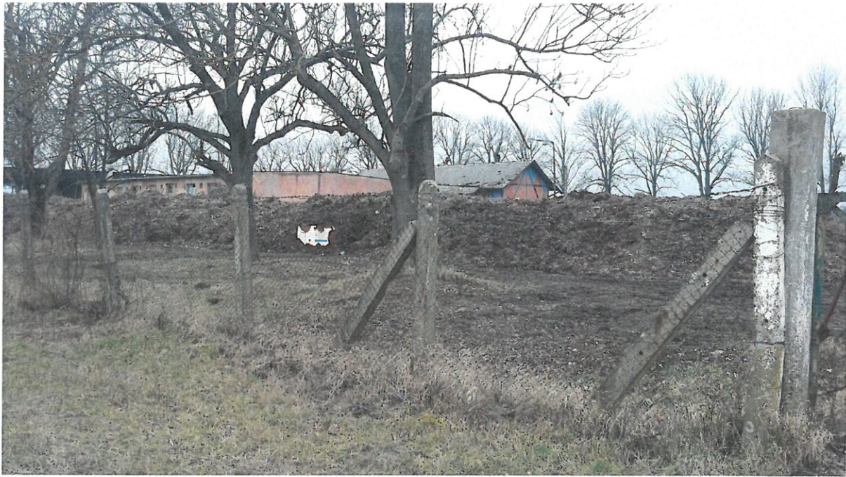
Lokalita skladov PHM – Koronč