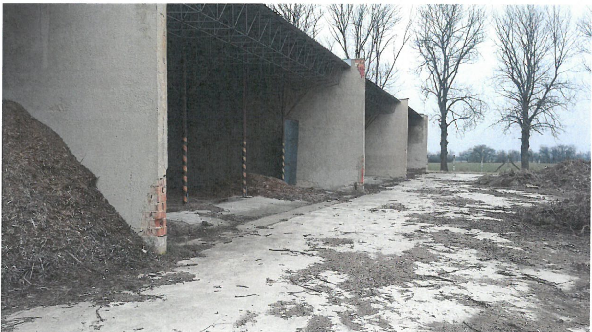
Prístrešky – v každom z piatich segmentov je konštrukcia strechy podpieraná stôjkami v počte 12 ks. Pre lepšiu manipuláciu pod prístreškom je potrebné počet stôjok zredukovať stavebným zásahom v konštrukcii strechy.